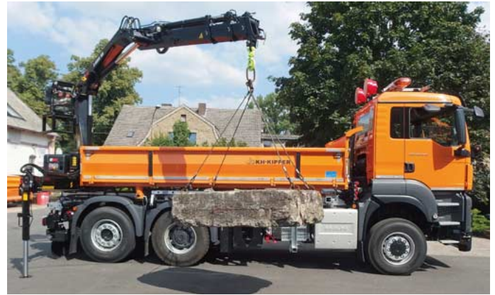
Der im Winterdienst eingesetzte Salzstreuer von Küpper-Weisser kann mit Sole und mit Salz betrieben werden (unten). Zusätzlich verfügt der 3-Achser über einen Hiab-Ladekran am Heck (oben).

gen der aggressiven Wirkung von Salz wurde der Aufbau vor der Lackierung verzinkt, um ihn vor Korrosion zu schützen. Auch Stützen und klappbare Tritte erleichtern den Zugang zum Aufbau. Das Hydrauliksystem wurde mit Bioöl befüllt. Der Unterflurkipppylinder ist verchromt, was ihn korrosionsbeständig macht sowie Haltbarkeit der Dichtungen und des gesamten Kippzylinders erhöht. Die abklappbaren Seitenbordwände verfügen über eine Federentlastung und können bei Bedarf demontiert werden. Die Kipperzusatzausstattung umfasst unter anderem eine klappbare Aufstiegsleiter unter dem Kipperboden, fünf Paar Zurrösen zur Sicherung des