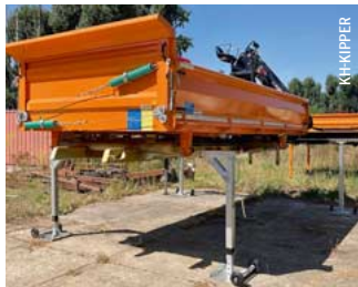
Der Aufbauwechsel nimmt nur wenige Minuten in Anspruch. Der jeweils nicht genutzte Aufbau ruht auf vier Stützen.

KH-Kipper bietet auch Wechselsysteme in der Kombination von Kipper und Betonmischer an.